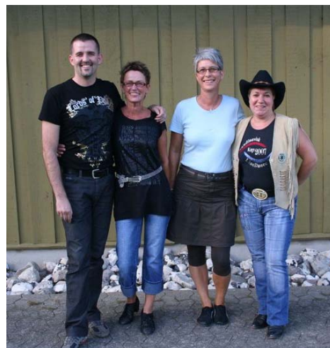
Instruktørerne af de fem årdsanse

Det var bare sejt, at så mange stillede op. Vi håber på mindst ligeså mange forslag næste år.